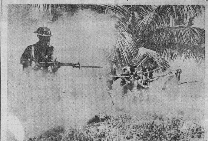
El regimiento número 65 de los Estados Unidos, destacado en Puerto Rico, ha estado efectuando maniobras en Punta Salinas, como ensayo para los "juegos" más serios que serán realizados en dicho punto el año próximo.