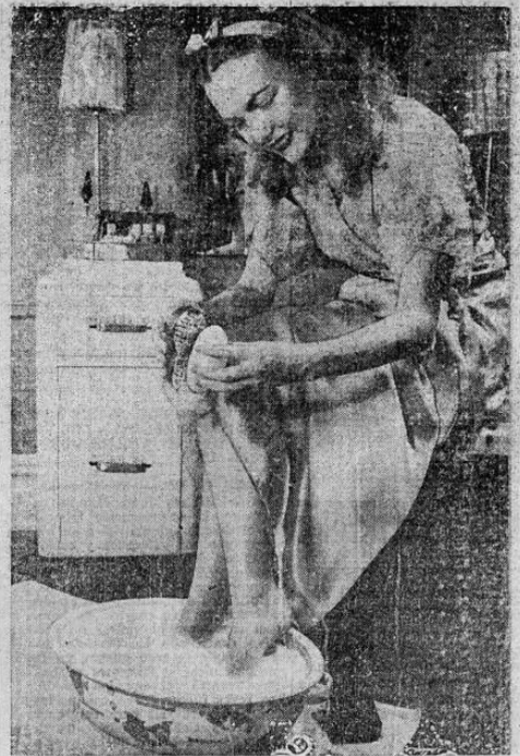
Un arreglo semanal de los pies, está considerado como parte de la rutina de la belleza femenina. Ahora se hace necesario que los dedos de los pies aparezcan tan bien arreglados como los dedos de las manos.

Una limpieza constante y una función esmerada de la cutícula con el polvo de naranja y con toallitas húmedas, hace que la cutícula se muera y se vaya renovando gradualmente hasta no hacerse necesario el corte de la misma. Y por supuesto, cuando ya tenga completamente limpia la superficie, será el momento de aplicar el esmalte, que debe combinarse con el que usted usó en las uñas de las manos.